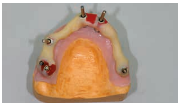
Изготовление верификаторов для снятия индивидуальной ложки рабочих слепков