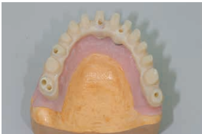
Изготовление пластикового прототипа