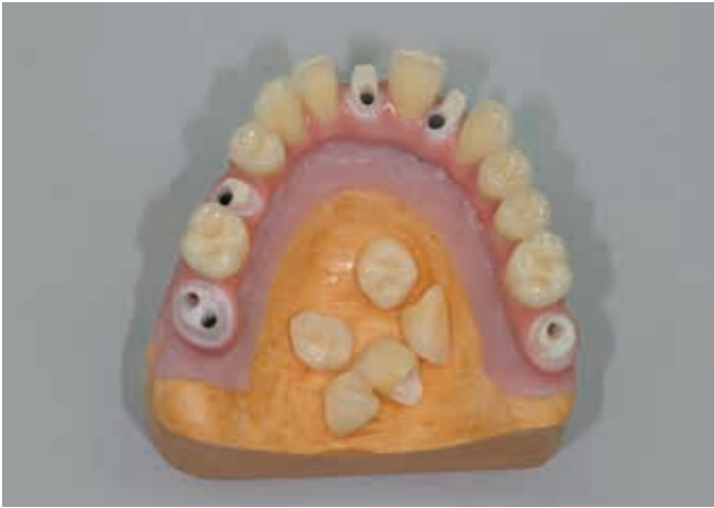
Готовая работа с циркониевыми коронками облицованными керамикой