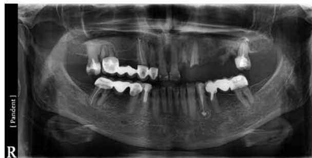
Орто пациентки до имплантации