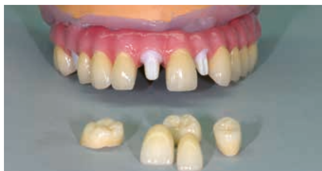
Готовая работа с циркониевыми коронками облицованными керамикой