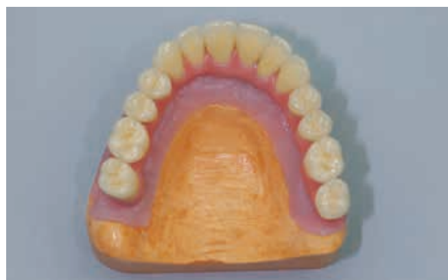
Готовая работа на модели