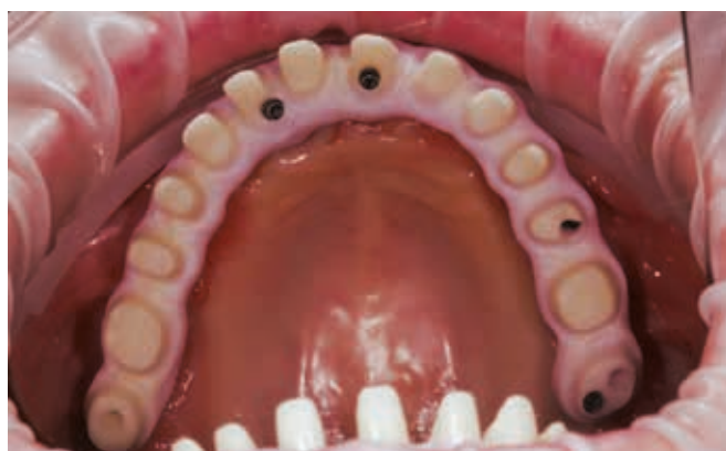
Циркониевый каркас в полости рта