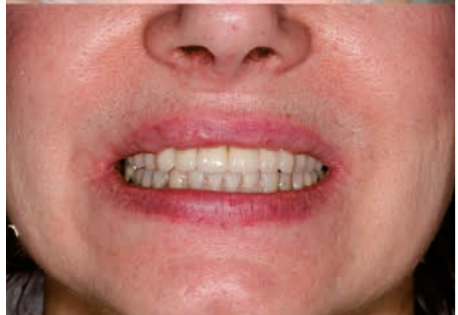
Фотография пациентки до и после протезирования