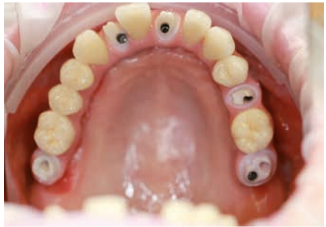
Готовая работа в полости рта