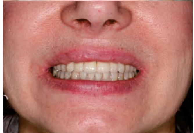
Фотография пациентки до и после протезирования