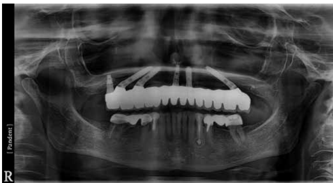
Орто после фиксации готовой работы