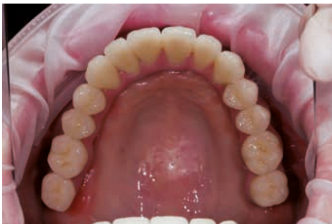
Готовая работа в полости рта с зацементированными циркониевыми коронками